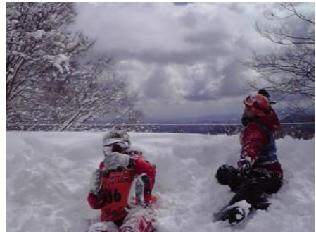
“スタッフをいじめる”の図。もうボロボロです。