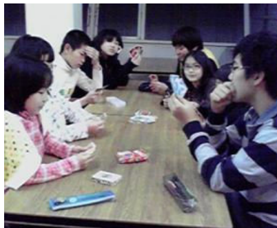
夜のカードゲーム大会！トランプ、ウノ、カルタで盛り上がる！