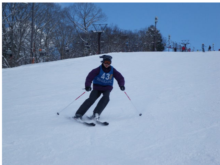
カービングターン練習中！遊びながらも、やるときゃやる！