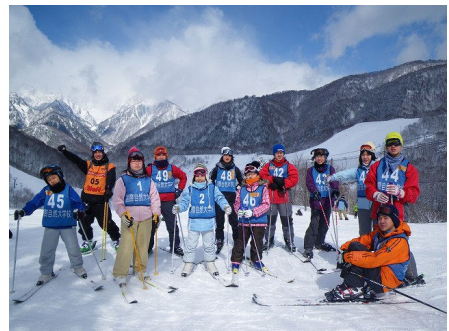
レベルアップスキー、全員集合！青空気持ちはいいね～！