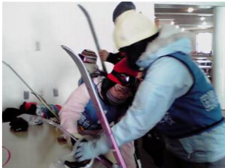
レッスン前には、自分たちでワックスを塗ります。