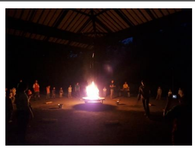
キャンプ最後の夜は、キャンプファ イヤーを楽しみました。