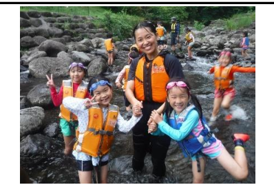
とても楽しみにしていた川遊び、夢中で遊びました。