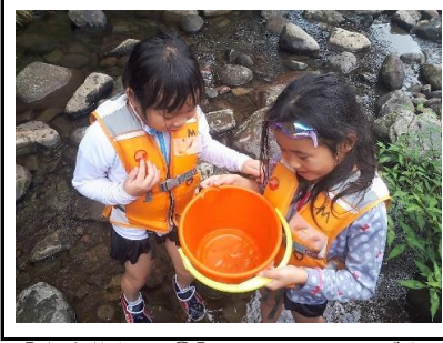
【生き物探し②】2人でアメンボを ゲット！間近でじっくり観察です。