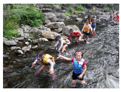
【いざ上流へ！】水流の強さに驚き ながら、流れに逆らって上流へ。