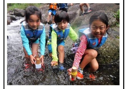
【船作り②】さっそく浮かべてみま す、どの船が1番早く流れるかな。