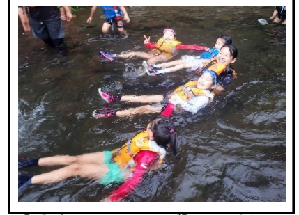
【ボディラフティング】川の流れに 身をまかせて流れてみました。