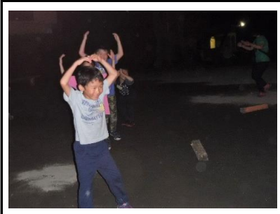
スタッフの出し物で大盛り上がり！