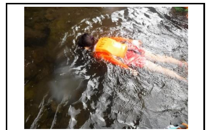
【素潜り】透明度が高く、川底まで見通すことができました。