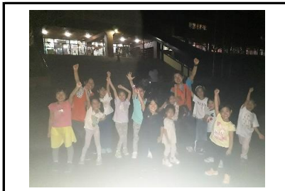
辺りは真っ暗、ドキドキしながら夜の森の探検へ！