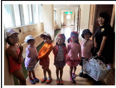
着替えを済ませて準備万端、身支度もチャレンジの1つです。