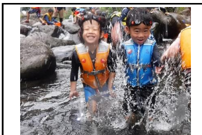
【水かけ】子どもも大人もビショ濡れになるまでかけ合いました。