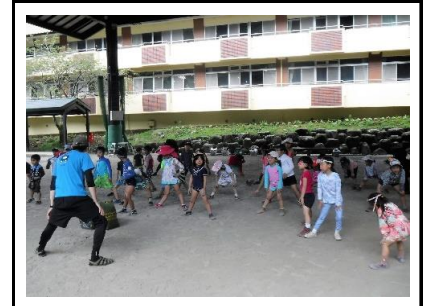
ケガ予防のための準備体操、しっかり体をほぐしていきます。