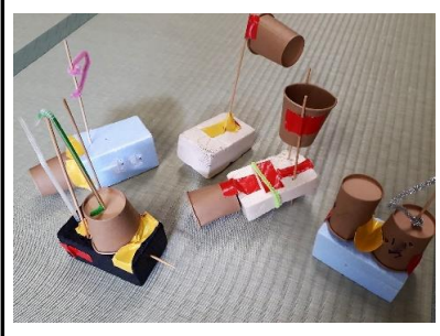
【船作り①】お手製の船を作りまし た。個性溢れる船ばかりです。