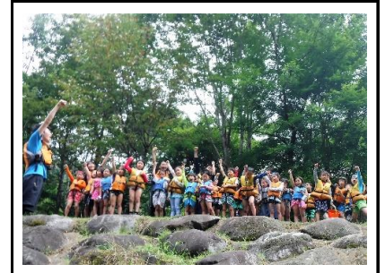
「最後の川遊びも楽しむぞー！」3 日間、川遊びを満喫しました。