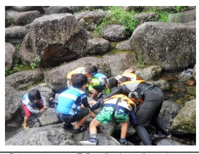
【生き物探し①】「ザリガニだ！」 色々な生き物を発見しました。