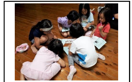
1日の終わりに楽しかったことを日記に書きました。