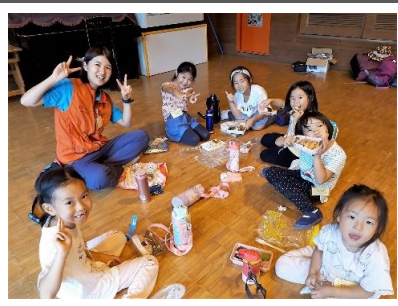
桃沢野外活動センターに到着し、まずはお昼ご飯を食べました。