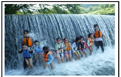
希望制で滝に打たれるチャレンジも行いました。