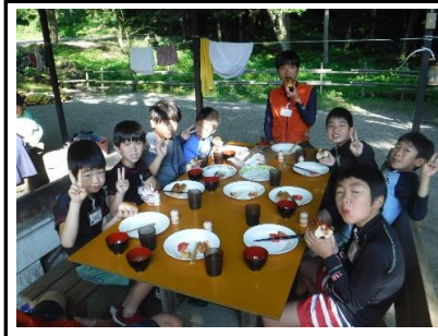
毎日しっかりご飯を食べて元気に過ごしました。