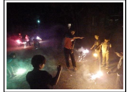
少しの時間ですが、夏の風物詩を満喫する時間でした。