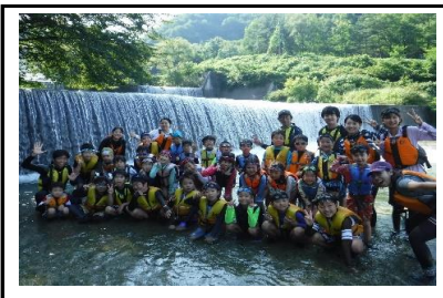
2日目の午後は上流の滝を目指して探検です。