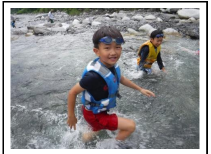
長いバス旅を乗り越えた末の川遊びは、格別の楽しさでした。