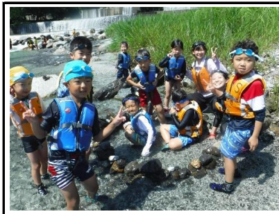
最終日は『温泉づくり』が人気の遊びに。大きな温泉が完成しました。