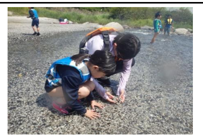
砂で遊んだり、生き物を探して遊ぶ子もいました。