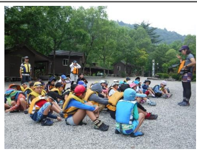
キャンプ場に到着！まずは川遊びのルールや道具の使い方を学びます。