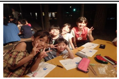
夜の日記タイム。1日でとっても仲良くなりました！