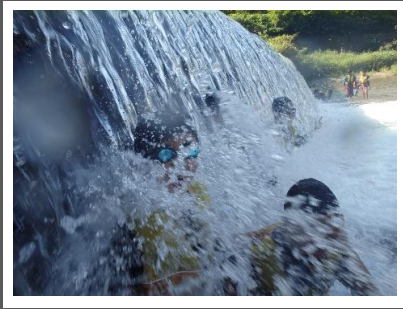
滝の向こう側へ潜ってみるメンバーもいました。