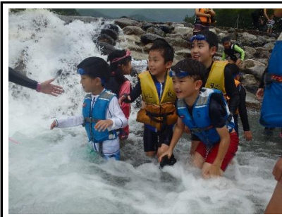
川遊びスタート！早速水しぶきのあがる場所へと向かいます。