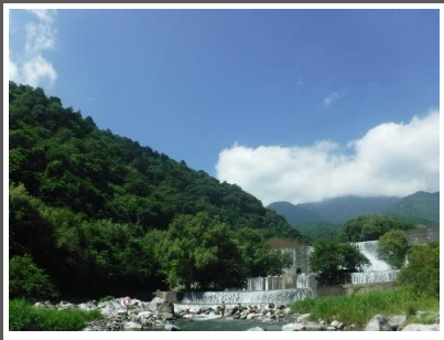
最終日。今日も絶好の川遊び日和です！