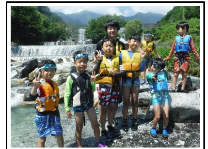
たっぷり川遊びを楽しんだみんな。またキャンプで会いましょう！