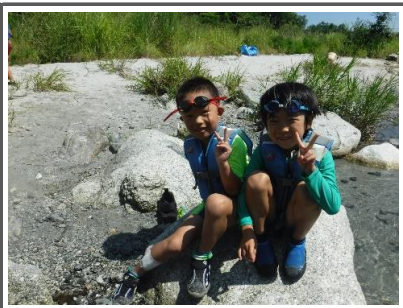
身体が冷えたら太陽に温められた石に座ってひと休憩。