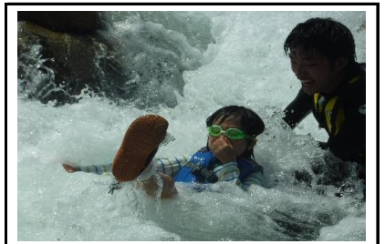
ダイナミックな『ボディラフティング』が大人気！