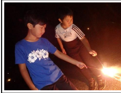
夜は手持ち花火。あちこちで歓声があがります。