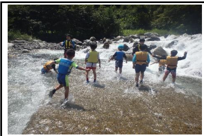
2日目。「スタート！」の掛け声とともに川にまっしぐらです。