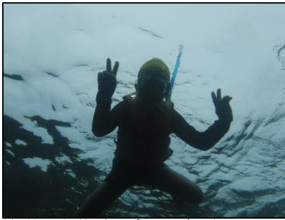
午後も海遊び。ピースができるくらいリラックスしています。