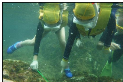
練習のあとは観察タイム。隠れている魚を観察しました。