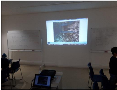
夜のプログラムは、スライドショーで見た魚をチェックしました。