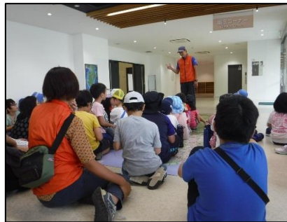
伊豆高原学園に到着しました。まずはオリエンテーション。