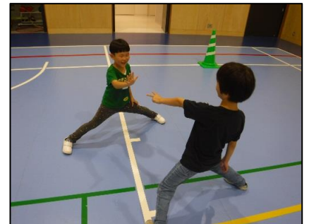
レク大会では、はじめましての友だちとも仲良くなりました。