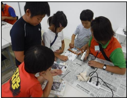
思い出クラフトは貝殻を使ったフォトフレームを作りました。