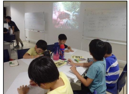
お絵かきをしたチームは魚の特徴を捉えて絵を描いてくれました。