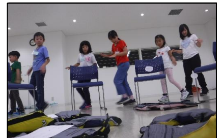
夜のプログラムでは、生き物を発見するコツを伝授！練習しました。