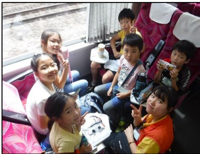
スーパービュー踊り子号に乗って出発！スタートから元気一杯！

<3日目> 起床、片付け 思い出クラフト お土産タイム 伊豆高原出発 移動、解散