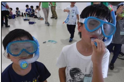
明日のスノーケリングに向けて、道具の確認！