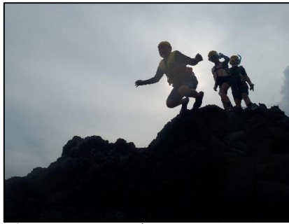
岩の上からの飛び込みにドキドキ！勇気を出してジャンプ！