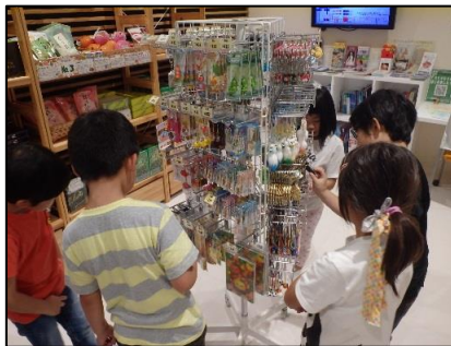
お土産タイムでは、計算をしながらお買い物をしました。