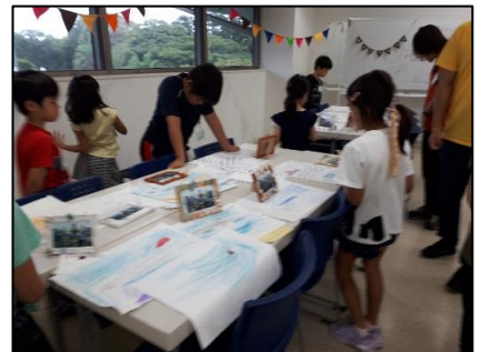
最後は自由研究とフォトフレームを並べて展覧会。