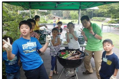
ウェルカムBBQでは、お肉や野菜を丸ごと焼いて、いただきます！