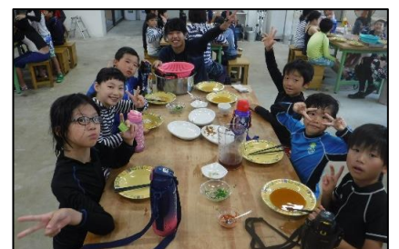
昼食は、現地スタッフの特製そうめん！おいしくいただきました。