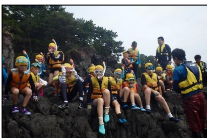
いよいよメインプログラム！道具を着用して、安全の確認。